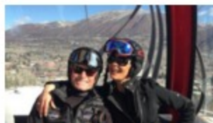
Michael Douglas y Catherine Zeta-Jones, en la nieve