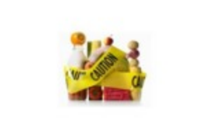
Los 17 alimentos más peligrosos del mundo